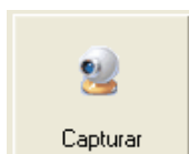
Cadastro de Funcionários

Para Inserir foto no cadastro. Abaixo da caixa da imagem da foto se encontra um botão que o levará a uma janela de captura de foto. A seleção da foto pode ser feita via Web-Cam (alguns modelos podem não ser compatíveis) ou via seleção de arquivo (BMP ou JPG) .